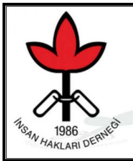
Logo de l'Association des droits de l'Homme « İnsan Hakları Derneği »