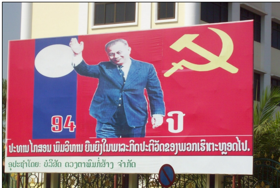
Affiche commémorant en 2015 le 94 e anniversaire de Kaysone Phomvihane, secrétaire général du parti communiste laotien, décédé en 1992