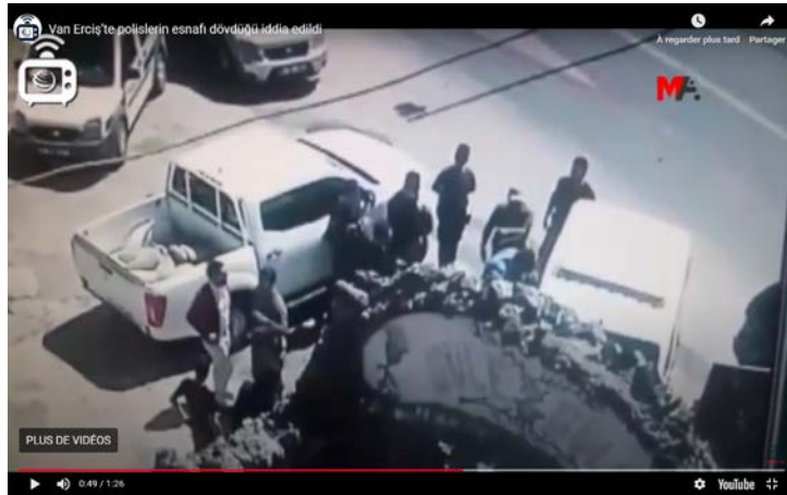
Cafetier battu par un policier à Erciş le 12 avril 2018