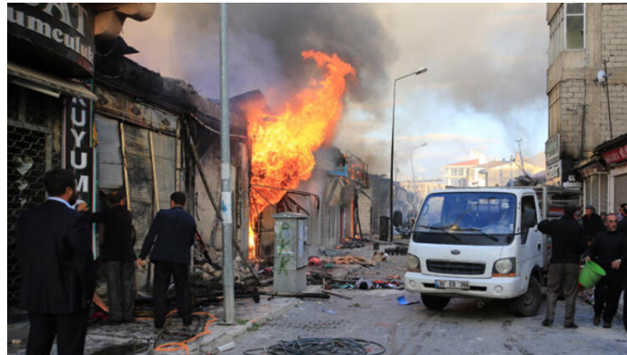
Emeute à Erciș lors d'une manifestation en faveur de la ville de Kobané le 7 octobre 2014

Le 7 octobre 2014, dans plusieurs localités de la province de Van, notamment à Erciș, des manifestants présentés comme « partisans du PKK » manifestent en faveur de la ville de Kobané (voir 1.) ; ils jettent des pierres contre la police et endommagent des bâtiments officiels ou du parti AKP. Le couvre-feu est décrété à Erciș 26 . Le quotidien libéral Hürriyet décrit ces violences en parlant d'un tué, des dizaines de véhicules et de lieux de travail incendiés, et compare les dégâts à ceux du tremblement de terre de 2011 27 .