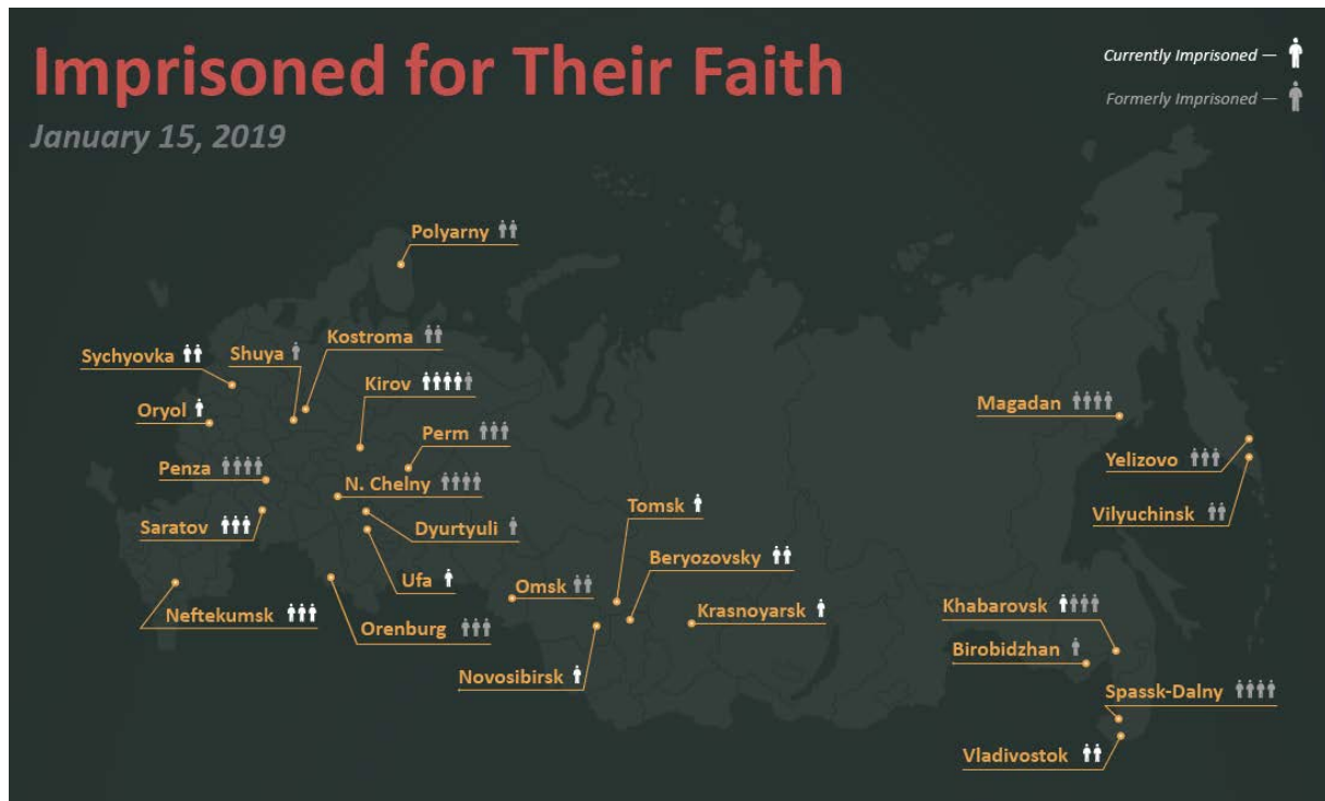
Carte du site officiel des Témoins de Jéhovah en Russie montrant les villes où sont détenus leurs coreligionnaires à la date du 15 janvier 2019 8

balles, ils mettent les gens au sol. En un mot, ils utilisent les mêmes méthodes que lors de l'arrestation de terroristes et de dangereux criminels » 7 .